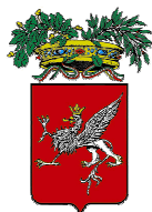
Provincia di PERUGIA